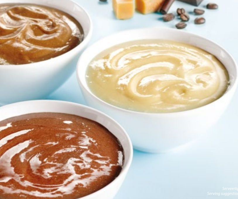
Serveertip Serving suggestion